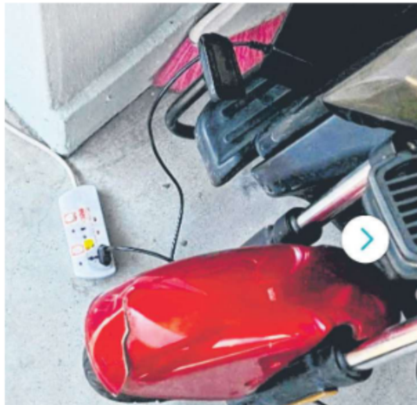
▲房先生称今年7月，拍到邻居从住家拉出插座，在走廊为代步车充电。