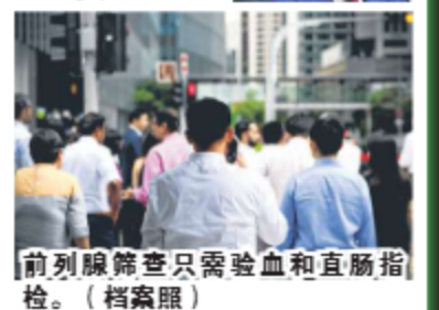
前列腺筛查只需验血和直肠指检。（档案照）

如果PSA水平提升或直肠指检不正常，病人可能需要进行前列腺磁共振成像 (MRI prostate) 检查。这项成像技术可以识别前列腺内的可疑区域，决定是否需